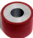
MMS 100100 Diamètre 100mm Largeur (A) 100mm Molette universelle