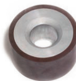
MMS 100500Q Diamètre 100mm Largeur (A) 50mm Molette universelle avec moyeu chanfreiné pour machine QUADRAX