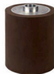
MMS 200220E Diamètre 200mm Largeur (A) 220mm Molette avec épaulement