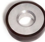
MMS 130400 Diamètre 130mm Diamètre moyeu 115mm Largeur (A) 40mm Alésage 50mm Molette universelle avec moyeu chanfreiné pour machine CEROX