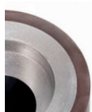
MMS 100130 Diameter 100mm Width 130mm Roller with hub and chamfered hub for CEREX, CEROLEX and QUADRAX machines