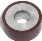
MMS 100500 Diamètre 100mm Largeur (A) 50mm Molette universelle