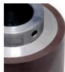
MMS 100100E Diamètre 100mm Largeur (A) 100mm Molette avec épaulement Pour machine du type CEROL